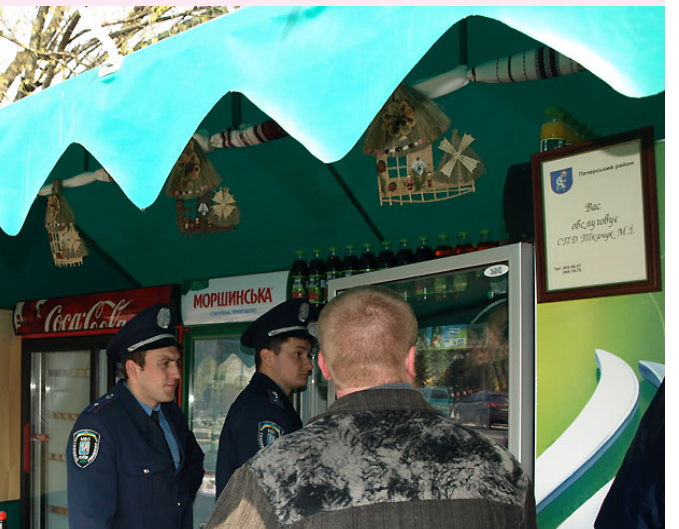
Міліція копірсається у майні приватного підприємця, навіть не набравши телефон власника з таблички.

Депутат Печерської районної у місті Києві ради від Блоку Юлії Тимошенко, голова Фонду духовного відродження "Думнич". Серед досягнень фонду - запровадження курсу "Духовної етики" по школам, підтримка обдарованої молоді, проведення конкурсів писанкарства, а також допомога літнім і малозабезпеченим людям. Активність у громадському житті та благодійності була б неможливою без серйозного економічного підґрунтя. Вона - приватний підприємець, веде роздрібну торгівлю продовольчими товарами.