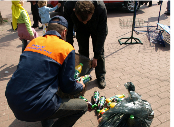
Продовольчі товари з холодильників у спеку вантажать в антисанітарну машину і везуть невідомо куди.